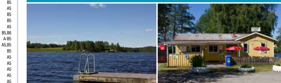
I Prässebo går det att svalka sig i Bodasjön. I Prässebo kiosk kan du köpa både mat och glass.

BAD- OCH FISKESJÖAR Under varma somrardagar finns möj- lighet att ta ett svalkande dopp. Vid Bodasjön i Prässebo finns en barnvänlig badplats med stora gräsytor, lekplats, sandläda, fotbollsplan, beachvolleyplan, grillstuga, flytbyggar, omlädningsrum, tillgänglighetsanpassad brygga och toa- lett och stor parkering. Här finns också sommartid en kiosk med gatufäk. Borydsjön är en populär badplats belägen öster om Lilla Edets centrum med parke- ring, flytbyggar och toalett. Vid Lilla Väktor finns en härlig badplats i Hjærtum. Här finns parkering, flytbyggar, omlädningsrum och toalett. Det finns många fina stigar runt sjön för dig att upptäcka. Många sjöar lämpar sig bra för fiske. Se baksidan för att hitta fiskevatten.