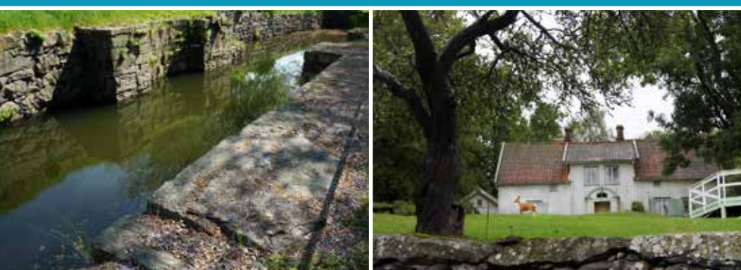
Sveriges första sluss kan du besöka i Lilla Edet, byggd 1607.

hämtat upp en liten del av de skatter som ruvar i Lödösejorden. Hos oss finns många historiskt intressanta hembygdsmuseum väl värda att besöka! Tösslanda skattegård har under flera århundraden varit bostad åt nämnden, häradsdomare och andra högt ställda personer. I den tillhörande la-dugården finns äldre lanbruksföremål att beskåda.