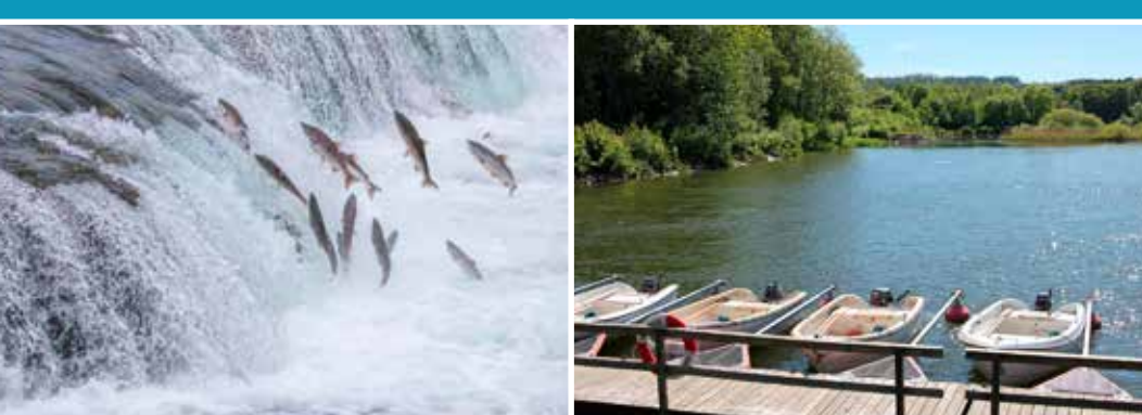
I Lilla Edet finns ett av landets bästa laxfiske.

också fångats. Rekordet i Lilla Edet är 18,1 kilo, kan du slå det? Fiskeäsongen är från mitten av april till sista september. Fisket sker både från land och båt. Fiskekort säljs i SFK Laxens stuga vid Göta älv. Laxen väger i genomsnitt 6 kilo, men många i 10-kilosklassen har