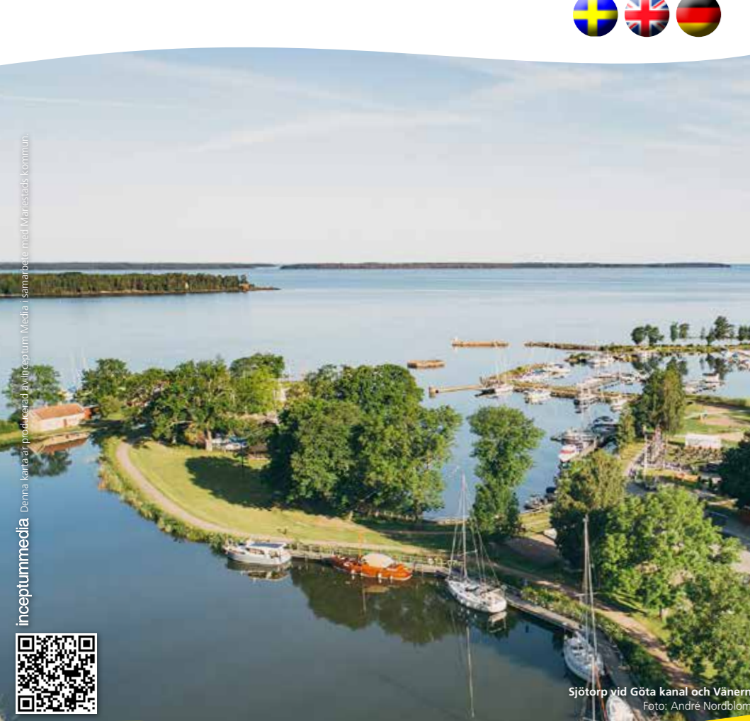
Sjöstaden i Göta kanal och Vänerby