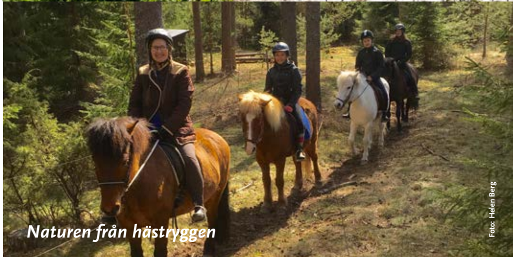
Naturen från hästryggen