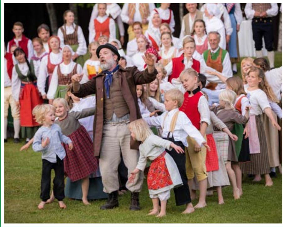
Wärmelängderna 2017.