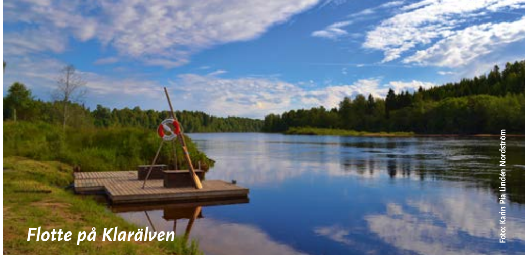
Flotte på Klarälven