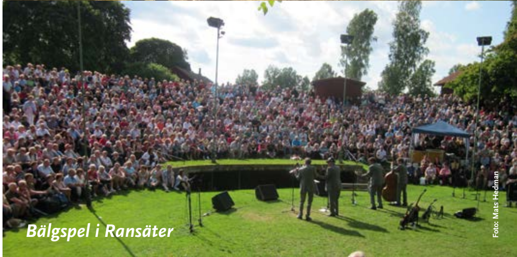
Bälgspele i Ransäter