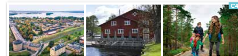
Guidade turer på KARLSBORGS FÄSTNING FORSVIKS BRUK TIVEDEN

Öppettider finns på www.visitaskersund.se